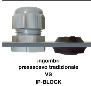
ingombri pressacavo tradizionale VS IP-BLOCK